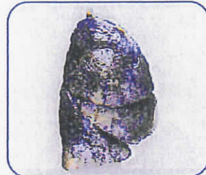
ヘビースモーカーな肺

ピコプラス スモーカーライザーは呼気中一酸化炭素濃度 (CO ppm)と換算されたカルボキシヘモグロビン (COHb %)を液晶画面に表示します。