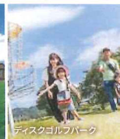
ディスクゴルフパーク

スマイルリゾートは、POW「サステナブル・リゾート・アライアンス」に加盟しています。 今シーズン、舞子スノーリゾートは舞子ゴンドラ1シーズン電気使用量の100%相当を再生可能エネルギー由来の電力に切替えます。冬を守るための取り組みを続けることで、ゼロカーボン化や持続可能なリゾートの実現につながると信じています。