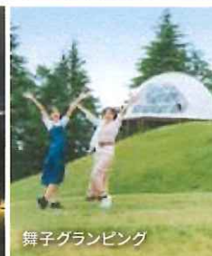
舞子グランピング