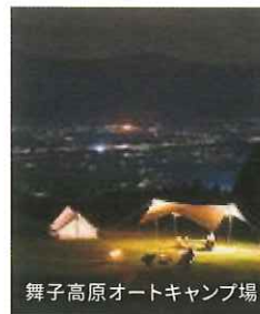
舞子高原オートキャンプ場